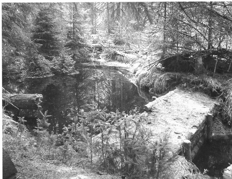
Stavba hrázek v NPR Kladské rašeliny

tvorbu a aktualizaci informačních tabulí pro veřejnost. Z dalších činností jmenujme alespoň likvidaci invazního borševníku velkolepého nebo ochranu žabích tahů.