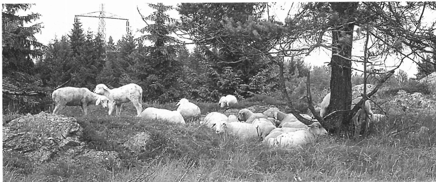
Pastva ovcí v NPP Křížky

Každoročně podporujeme i výsadbu stromů na nelesní půdě, tedy především podél cest a vodních toků.