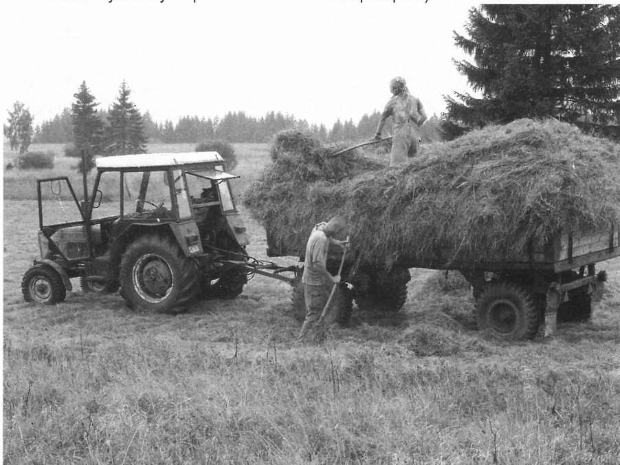
Odvoz pokoseného sena z Upolínové louky

poslední době stala obnova zaniklých tůň (povodí Pramenského potoka), které zvyšují biodiverzitu v krajině, umožňují reprodukci obojživelníků apod. Naopak, některé pozůstatky pro krajinu nevhodných lidských zásahů se snažíme zahladit – podporujeme činnosti směřující k zadržení vody v krajině (v rezervacích např. tvorbu hrázek na melioračních příkopech).